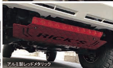
アルミ製レッドメタリック