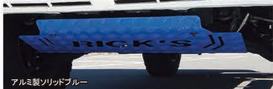
アルミ製ソリッドブルー