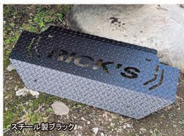
スチール製ブラック

■RICK'Sアシストミラーホールカバー 純正カラー仕様 コードA ¥8,800(税込) ●純正カラーNO.が必要となります。 ●材質はFRP製、付属両面テープにより簡単取り付けタイプ